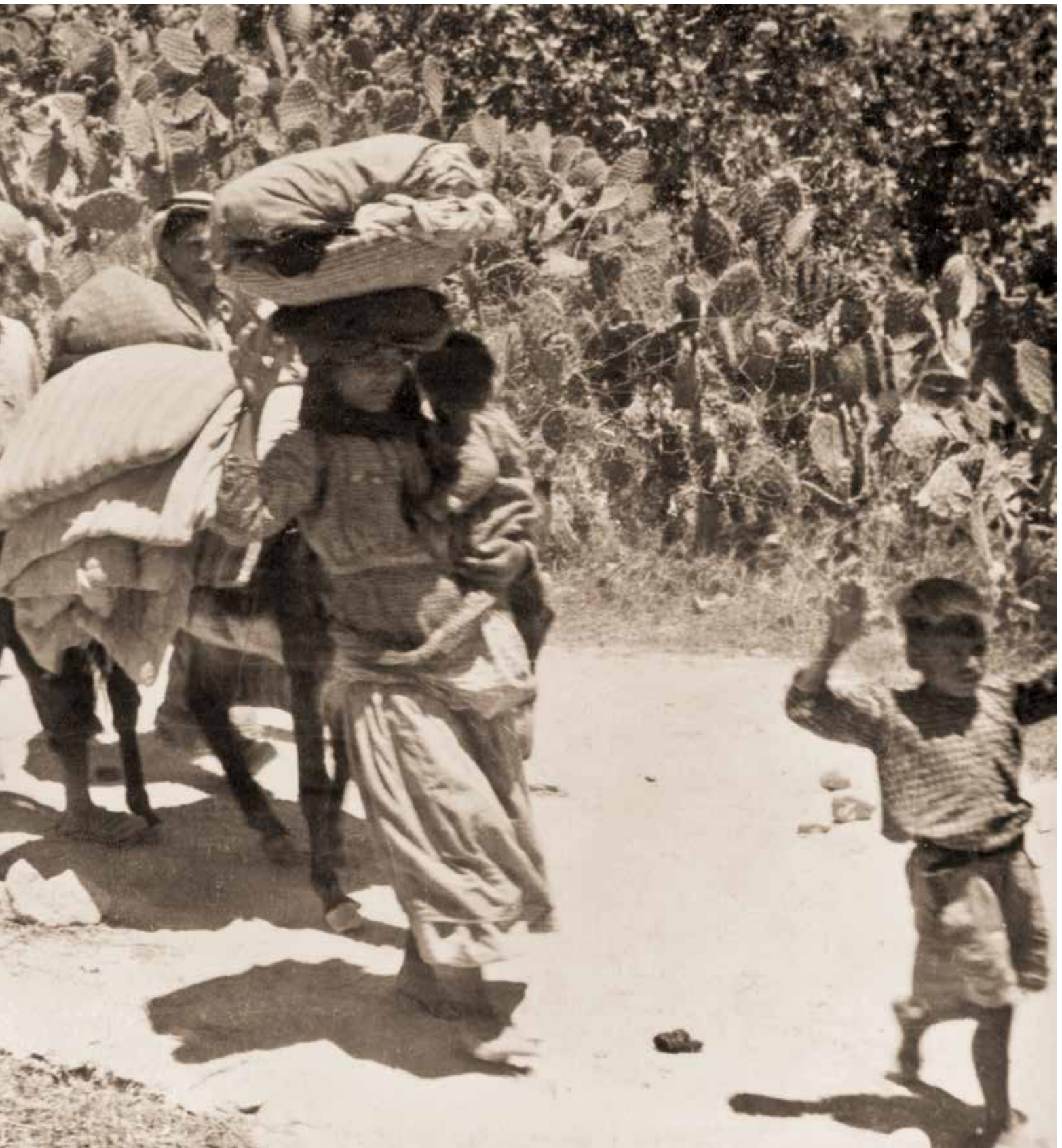
ילד מרים ידיים בשיירה של תושבים ערבים ב-48'. הצילומים שמופיעים בתחקיר זה נמצאו באוסף נדיר של לוחם גולני שנזרק לרחוב