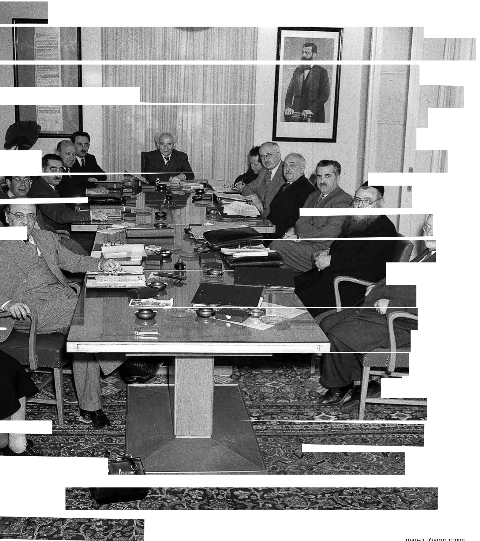
ישיבת ממשלה ב-1949. בן-גוריון בלם חקירה מעמיקה של הפשעים